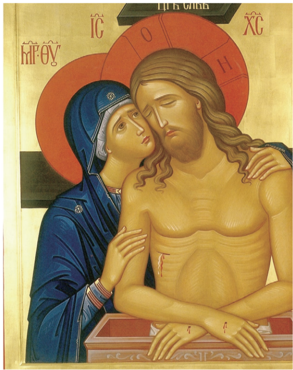
▲圖一／母親，請不要為我哭泣

是的，當我們了解、也隨同聖母的憂苦獻上每人生命中的十字架後，回過頭來看看這幾幅聖像畫，